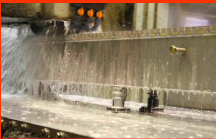
ワークのオーバーハング部や研削加工時の中空部をサポート。